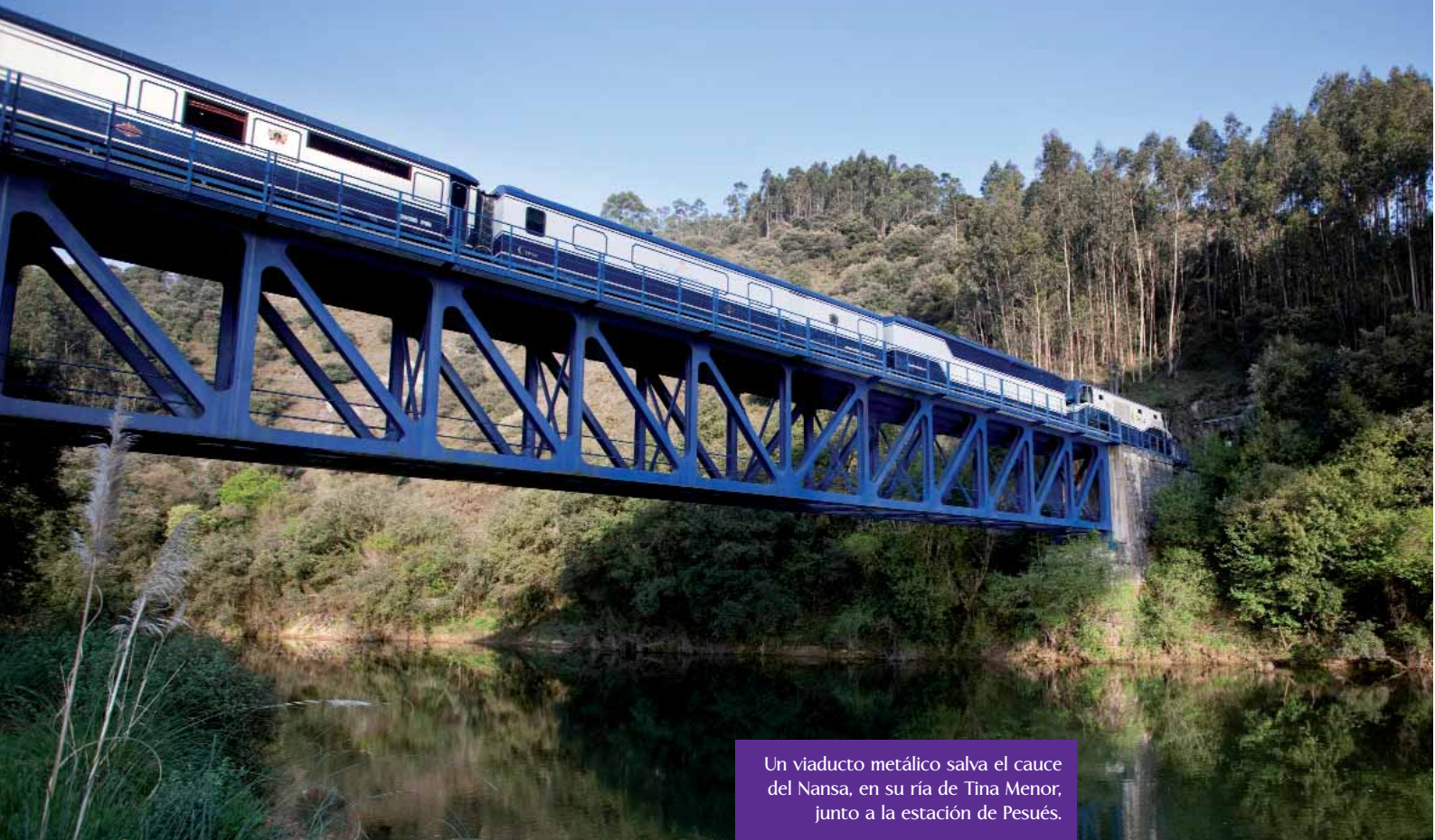
Un viaducto metálico salva el cauce del Nansa, en su ría de Tina Menor, junto a la estación de Pesués.

vuelta si hubiera plazas. Lo hizo y repitió, en un periodo de dos meses, otras dos veces el mismo viaje, tanto que se casi podía hacer de guía alternativo.