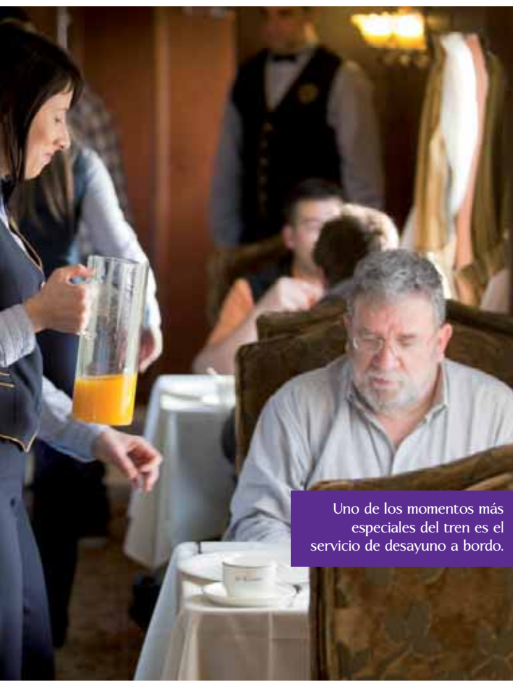
Uno de los momentos más especiales del tren es el servicio de desayuno a bordo.

El Transcantábrico Gran Lujo no es un tren barato. La oferta de trenes turísticos de Feve tiene una gradación de calidades, tiempos de viaje y precios que permiten ajustarse a los diversos tipos de demanda. La demanda esperada en este tren es para