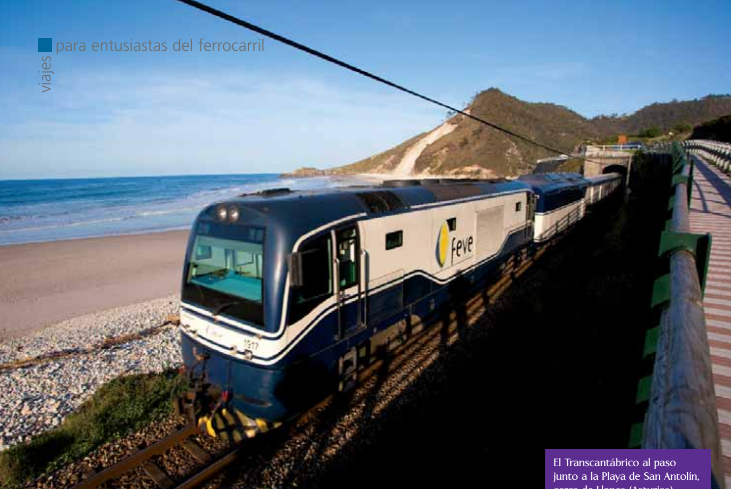
El Transcantábrico al paso junto a la Playa de San Antolín, cerca de Llanes (Asturias).