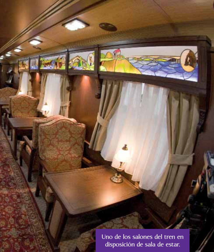
Uno de los salones del tren en disposición de sala de estar.