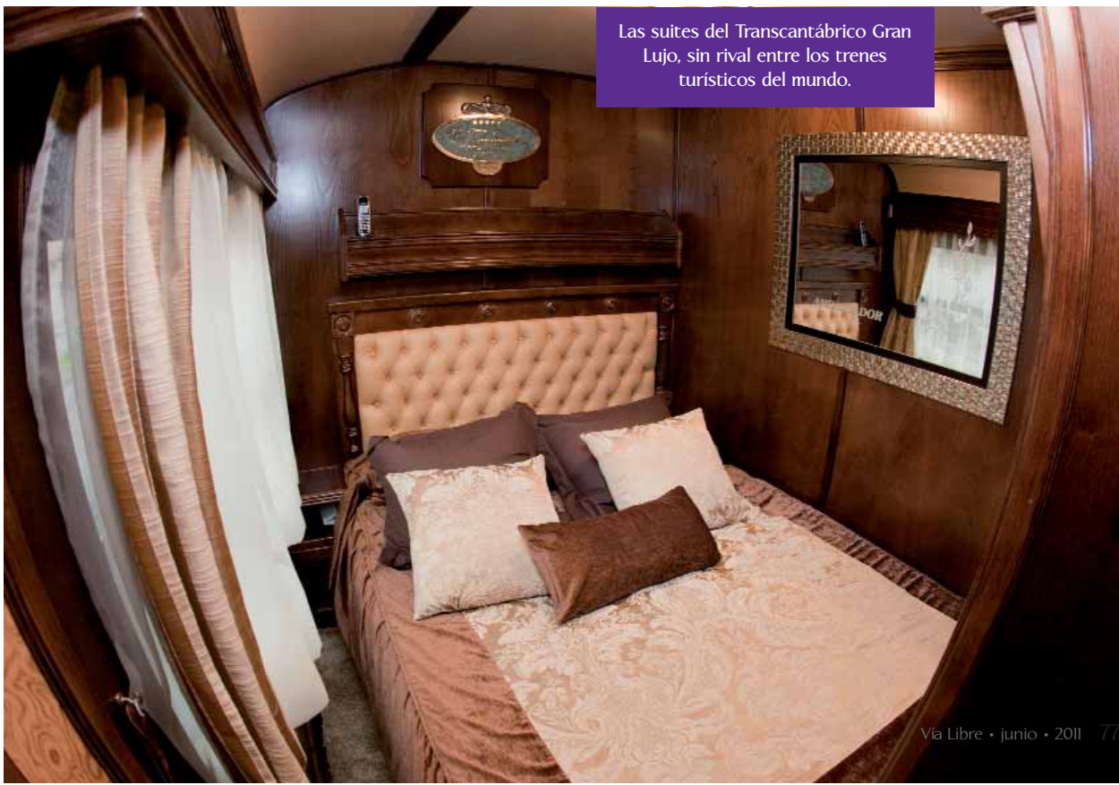
Las suites del Transcantábrico Gran Lujo, sin rival entre los trenes turísticos del mundo.

da, sin visitar durante este periodo ninguno de los talleres de Feve. En los meses de parada el tren realiza todas sus revisiones con cierta profundidad, desde torneados de ruedas o cambios en sistemas de frenos. En estas duras condiciones garantizar la plena operatividad del tren en el periodo de servicio requiere un mantenimiento especial. Para ello Feve ha dispuesto que una pareja de técnicos de Feve acompañen al tren en su ruta y que durante las para-