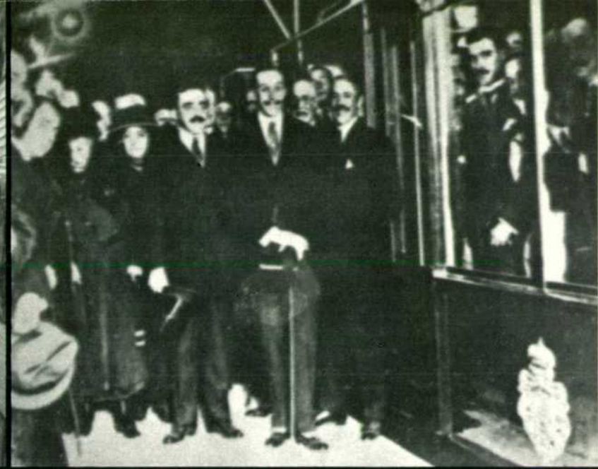
El Rey don Alfonso XIII inaugura el Metropolitano de Madrid.