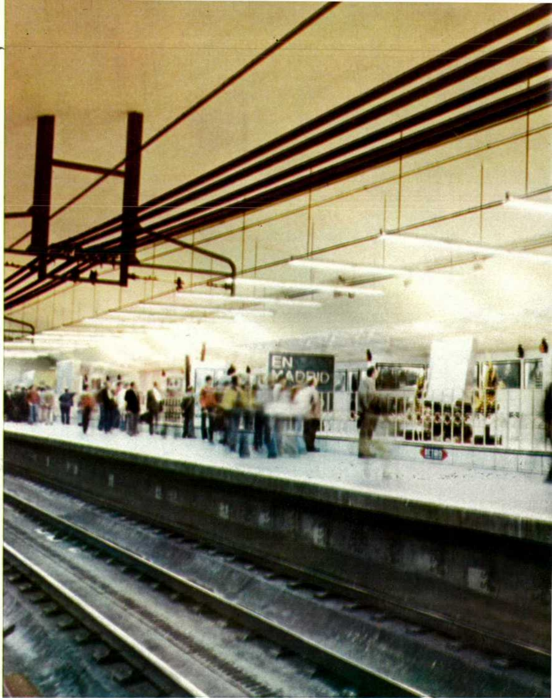
Vista general de la exposición "En Madrid..., el Metro".

Pasaron diez años hasta la inauguración de nuevas líneas, como son: Tetuán-Plaza de Castilla, en 1961; Vallecas-Portazgo, un año después; Argüelles-Moncloa, en 1963; Ventas-Ciudad Lineal, en 1964, y Callao-Carabanchel, en junio de 1968.