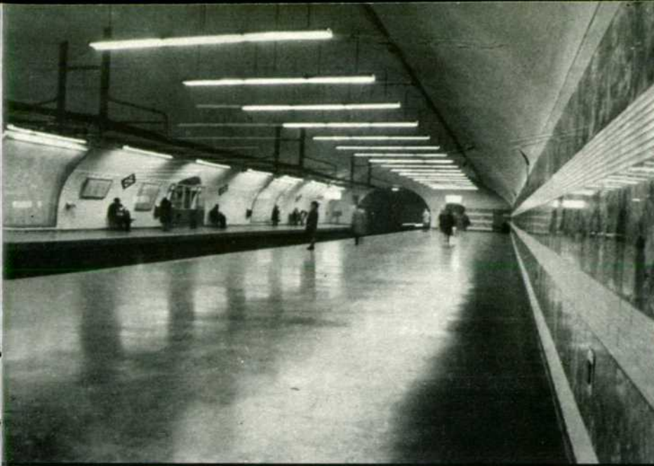
Este es el espacio, en uno de los andenes de la estación de Retiro, destinado a sala de exposiciones.