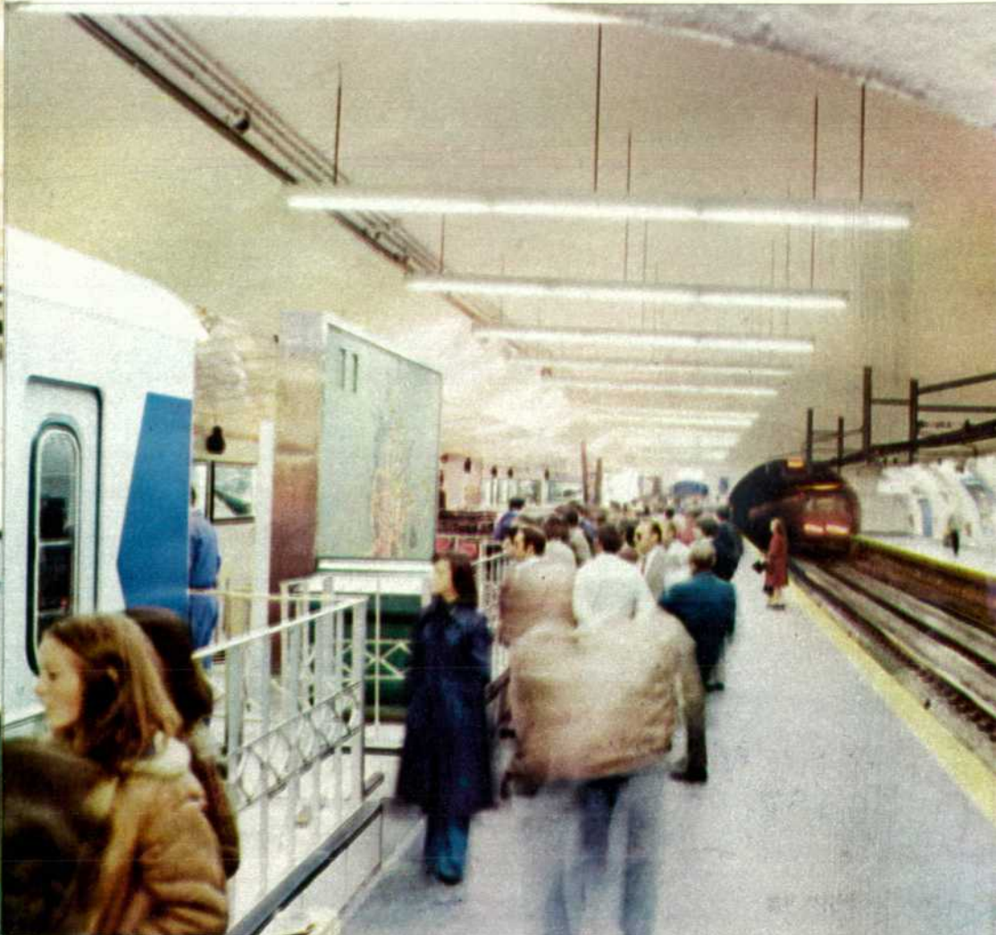
Un tren entra en la estación de Retiro mientras los viajeros contemplan la exposición.

■ En esta primera exposición, dedicada al popular "metro", se ha instalado una cabina estática que gracias a unos efectos de luz y sonido simula una auténtica cabina de conducción.