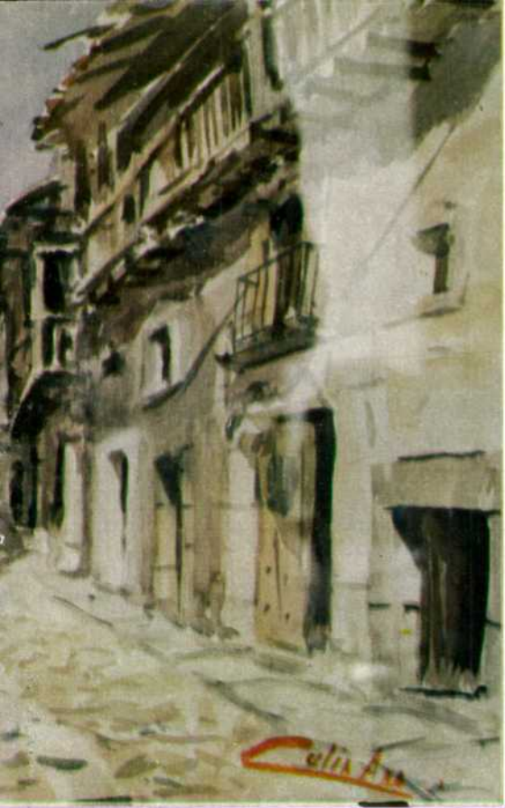
oficina (Madrid), pintora que consiguió medalla de acuarela con su brocha "Atardecer".