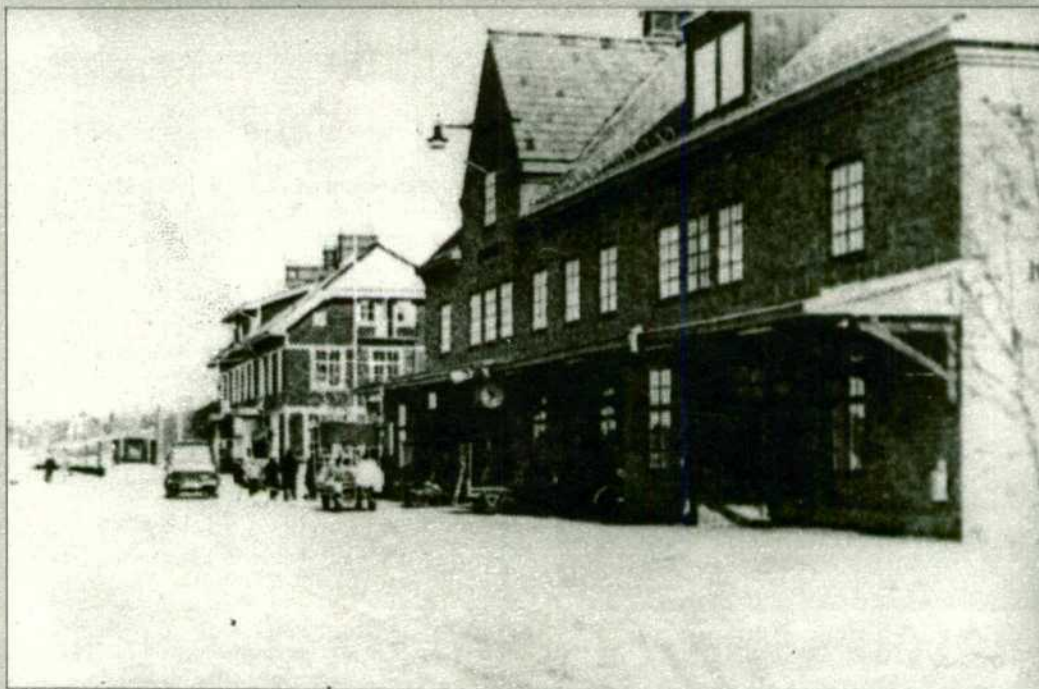
La estación de Kiruna —donde los riquísimos yacimientos de hierro—, casi cubierta por la nieve, mientras un poco más al Sur es primavera.

La oscuridad de fuera no deja ver muchos detalles, pero puede uno imaginarse los bosques blancos de abetos y los campos cubiertos de nieve cuando apretamos la cara sobre el cristal. Ya hemos llegado a Mjölby, en la llamada Suecia central que en realidad es la parte más meridional del reino. En Linköping tomamos una cerveza en el vagón restaurante, y vemos que la nieve y el hielo se han acumulado en montones de varios centímetros sobre los fuelles de paso de un vagón a otro. En el exterior se registran diez grados bajo cero, pero eso es nada para un viajero a Laponia.