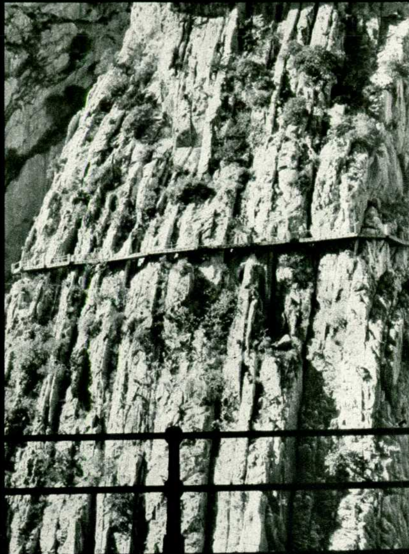
La pared cortada a pico y el Camino del Rey, en todo su esplendor.

remolcando trenes en la subida de Chorro y de los Gaitanes". Las obras dieron comienzo en 1861 y, es de suponer, significó una impresionante lucha con las dificultades de la Naturaleza, inaccesible incluso para las caballerías. El tramo de Alora a Córdoba quedó listo el 15 de agosto de 1865 (2).