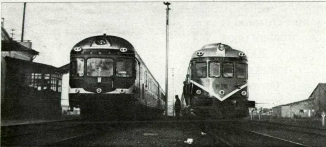
Ter y Taf, los mejores automotores de la RENFE, se cruzan en la «Ruta de la Plata». Abajo, cementerio de locomotoras en Zamora, visto desde la cabina del Taf.