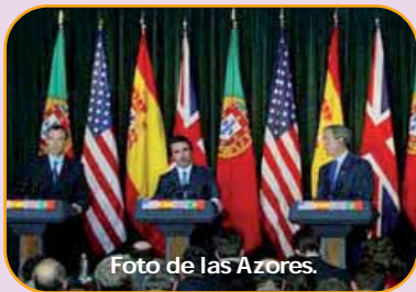
Foto de las Azores.

Pese a la negativa de la ONU, George Bush encuentra en las Islas Azores el respaldo de los que será su principal aliado en esta aventura, el primer ministro de Gran Bretaña, Toni Blair . Se suman a la