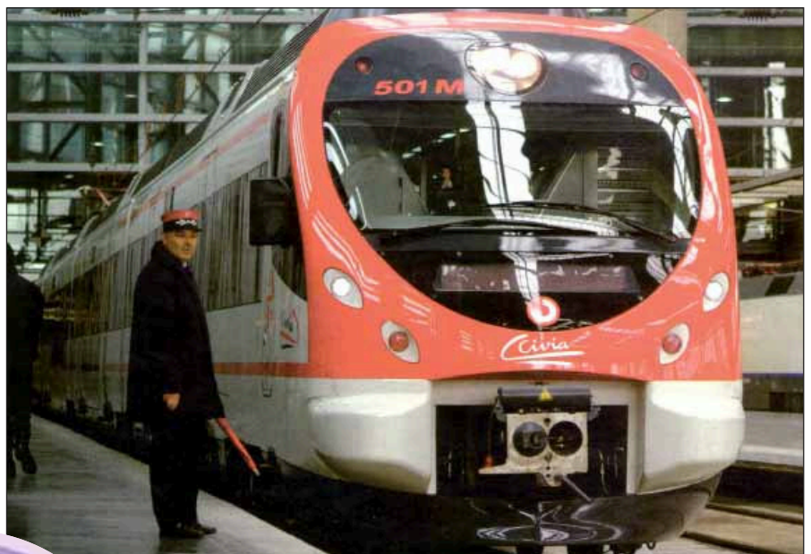
En 2003 entró en servicio la línea Madrid-Lérica y los nuevos Civia.