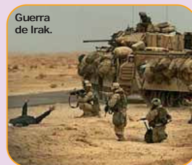
Guerra de Irak.

Ocho meses más tarde Sadam Hussein es encontrado en un refugio cerca de Trikrit y, tras un largo debate sobre dónde se le debe enjuiciar, es puesto a disposición de un tribunal iraquí para responder por crímenes de guerra.