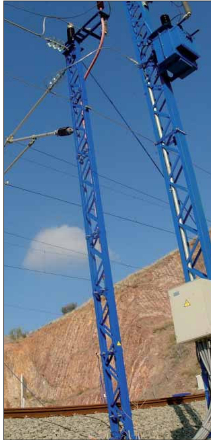
La interoperabilidad avanza en todos los frentes, vía, electrificación, señalización...

En nuestro país el Parque Natural de Doñana sufre otro desastre ecológico. La rotura de una presa de residuos de una explotación minera en