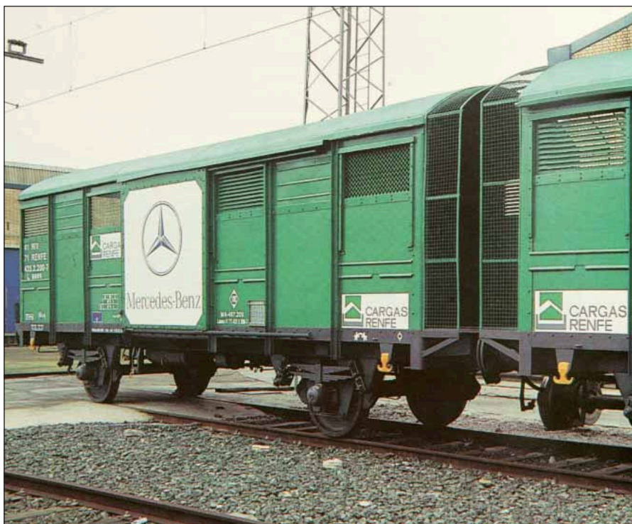
Renfe desarrolló el primer vagón para el transporte de monovolúmenes.

baban entonces los ocho trenes Ave destinados a circular por el Corredor Mediterráneo con ancho ibérico y 3.000 voltios de tensión de alimentación.