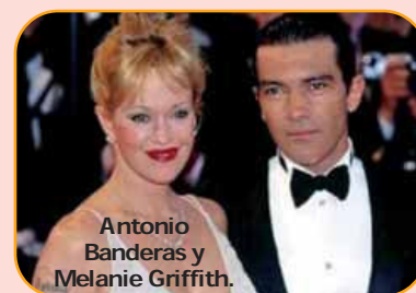
Antonio Banderas y Melanie Griffith.

A Asia tampoco ha llegado el mal de las vacas locas y sin embargo desde Kabul llegan imágenes de ahorcados. Los integristas ocuparon militarmente la capital Afgana y muestran al mundo la mano implacable de la ley islámica. Esta vez el hombre que pendula sin vida en la horca es Mohamed Najibulá , ex presidente del país.