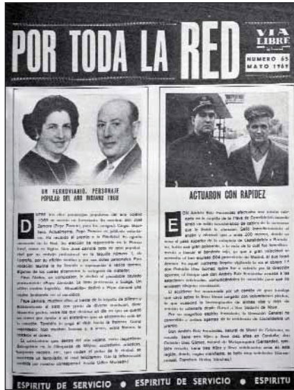
Una portada del "Por Toda la Red".

Y continuaba también la mejora de las instalaciones de la que son buenos ejemplos el nuevo puente mixto -ferrocarril y carretera- sobre el río Tinto, en Huelva, los nuevos enlaces ferroviarios de Zaragoza y la primera estación ferro-