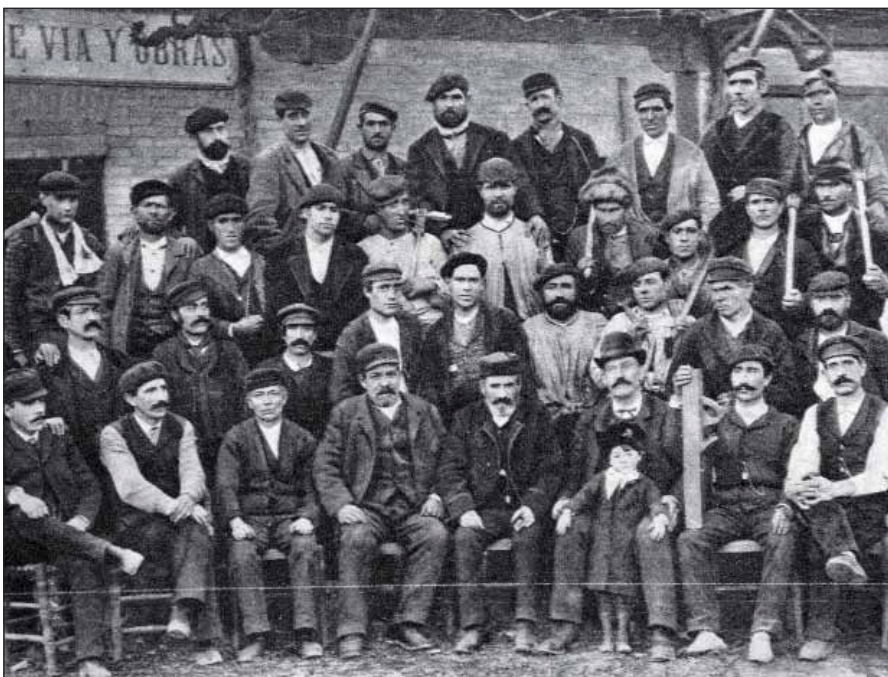
La primera "estampa de ayer" publicada.

En el terreno de los ferrocarriles urbanos, Barcelona abrió su nueva línea de metro de cinco kilómetros entre Collblanch y Rambla de Cataluña en una maratoniada jornada de inauguraciones del ministro López Rodó que incluyó el tramo de 18 kilómetros Barcelona-Garriñans de la autopista a La Junquera. Alicante despedía, en noviembre, a los tranvías de sus calles "sustituídos por modernos autobuses". □