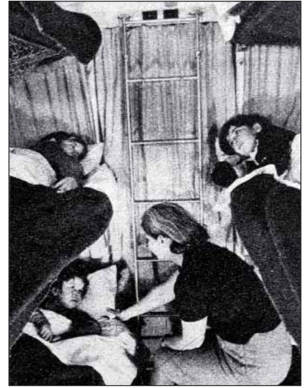
Madrid-París en coches literas.

En el ferrocarril, la modernización continuaba, con un nuevo TER directo entre Madrid y Caste-