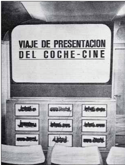
La novedad del coche-cine.

prestar servicio la estación de Madrid-Delicias, hoy sede del Museo del Ferrocarril y durante muchos años la única estación "internacional" de la capital. El honor de ser el último tren de viajeros que salió de la terminal, el 30 de junio, le cupo al expreso de Badajoz, arrastrado por la locomotora diésel 10.817.