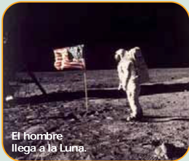
El hombre llega a la Luna.

ante el grito unánime "yankees go home". La prensa europea comienza a publicar informaciones según las cuales las tropas norteamericanas habían cometido en Vietnam crímenes sólo comparables a los de los nazis durante la Segunda Guerra Mundial. Su retirada de Indochina supone un giro completo en la guerra.