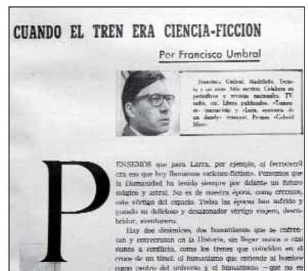
Francisco Umbral en VIA LIBRE.