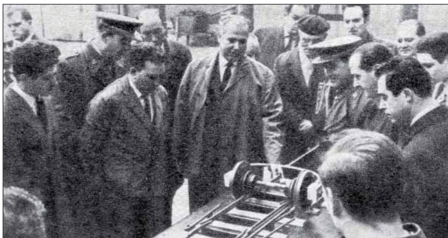
Pruebas del sistema RAV de Muñiz Aza.

Pero no sólo de modernización vive el ferrocarril y mirando al pasado Renfe iniciaba los estudios para establecer un Museo del Ferrocarril y ya se pensaba para situarlo en los bajos del edificio que hoy es sede de la Fundación de los ferrocarriles Españoles, el Palacio de Fernán Núñez. □