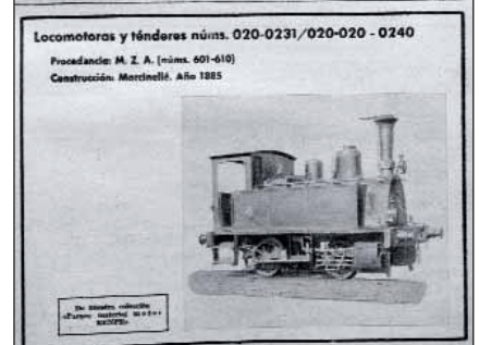
Las primeras fichas de material.

hacia lo propio entre Madrid y Gijón. Además, se iniciaba el servicio del expreso Costa Brava entre Madrid y Port Bou y los Talgo II sustituían a los II en el Madrid-Hendaya y el Madrid-Barcelona.