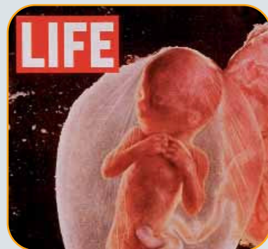
"Life" sorprende al mundo con la publicación de las fotografías de un embrión humano en el útero materno, obra del fotógrafo sueco Lennart Nilsson.