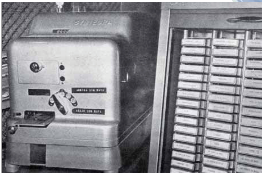
Nuevas máquinas expendedoras de billetes.

Nuevos servicios de cercanías con ferrobuses se implantaban entre Madrid, Guadalajara, Sigüenza y Talavera de la Reina.