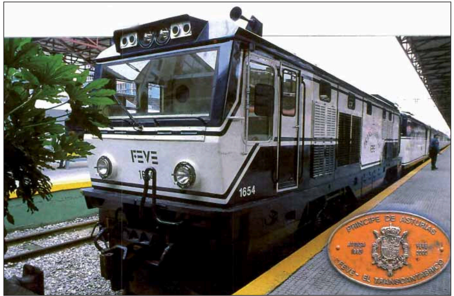
El Transcantábrico II entró en servicio entre El Ferrol y San Sebastián.

El año 2000 supone el principio del fin para uno de los mitos tecnológicos del siglo XX. Una unidad del avión supersónico Concorde se estrella poco después de despegar del aeropuerto parisino de Charles De Gaulle , y provoca la muerte de 113 personas. La investigación posterior a la tragedia demuestra que la estructura de este aparato no es compatible con los modernos estándares de la aviación comercial, lo que, meses más tarde, provoca el jubileo de toda la flota.