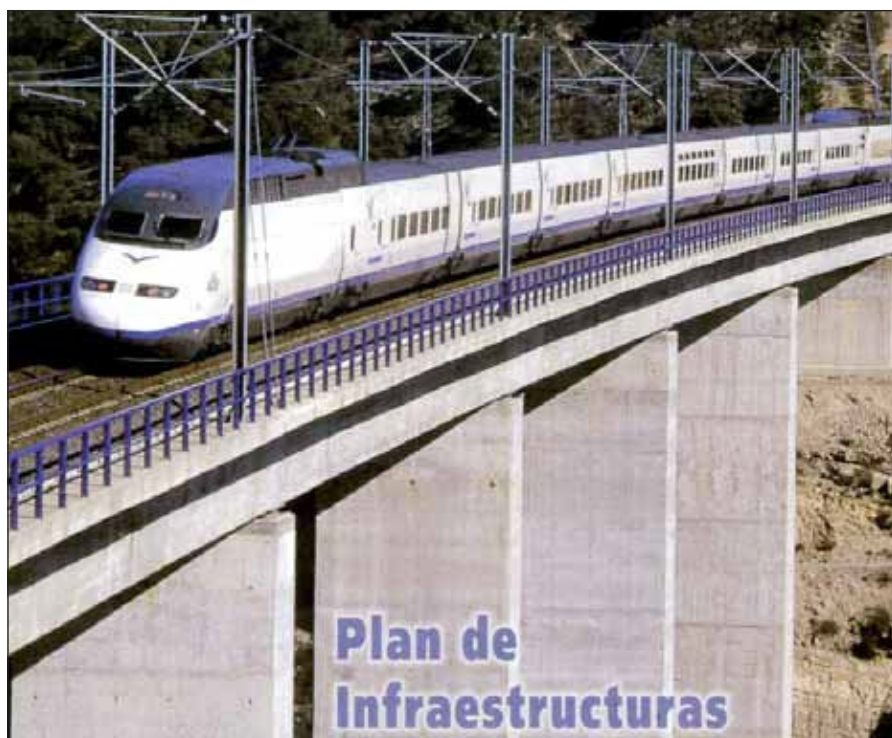
El Plan de Infraestructuras 2000-2010 preveía 6,8 billones de pesetas de inversión.

En el terreno de la política doméstica también menudean los nombres nuevos. De forma sorprendente el congreso del PSOE elige como nuevo secretario general a un joven y perfecto desconocido de nombre José Luis Rodríguez Zapatero . Tras la victoria por mayoría absoluta del Partido Popular, el segundo mandato de José María Aznar trae a la presidencia de las dos instituciones parlamentarias de ámbito nacional a dos nombres de mujer. Luisa Fernanda Rudi , ex alcaldesa de Zaragoza, será la cabeza visible del Congreso de los Diputados, mientras que la ex ministra de