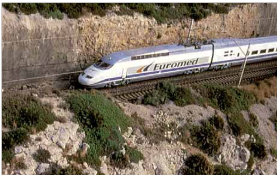
Entra en servicio los trenes Euromed.

variante de Guadarrama, el acceso a Valladolid y el norte de España desde Madrid, uno de los nuevos proyectos ferroviarios que se iniciarían en 1998 y que permitiría reducir los tiempos de viaje sustancialmente entre el centro peninsular y toda la cornisa cantábrica.