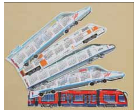
Los calendarios marcapáginas.

tipo- apoyaba eficazmente los textos. El Ave fue el primer "radiografiado".