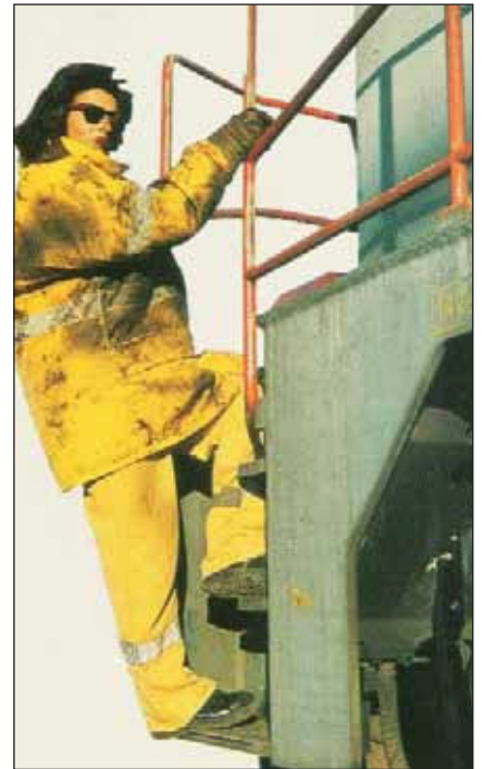
Se iniciaba la serie "profesiones".

Otra novedad del año fue la "radiografía", un desplegable que se añadía al interior de portada y que ofrecía una información muy completa sobre un aspecto concreto del ferrocarril, además, la infografía -fotos, mapas, planos y recursos gráficos de todo