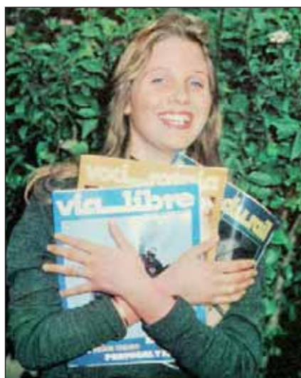
Tres revistas ferroviarias en "sintonía".

lada y pasaba al Museo del Ferrocarril. La despedida de la Marilyn no era la única aunque quizá sí la más sentida, Automotores, TAF y otras locomotoras que desde los años 50 habían venido desplazando a las locomotoras de vapor, ahora cedían ante el impulso de "las más potentes, limpias y económicas eléctricas".