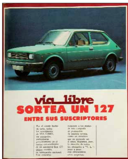
Un "127" para los suscriptores.