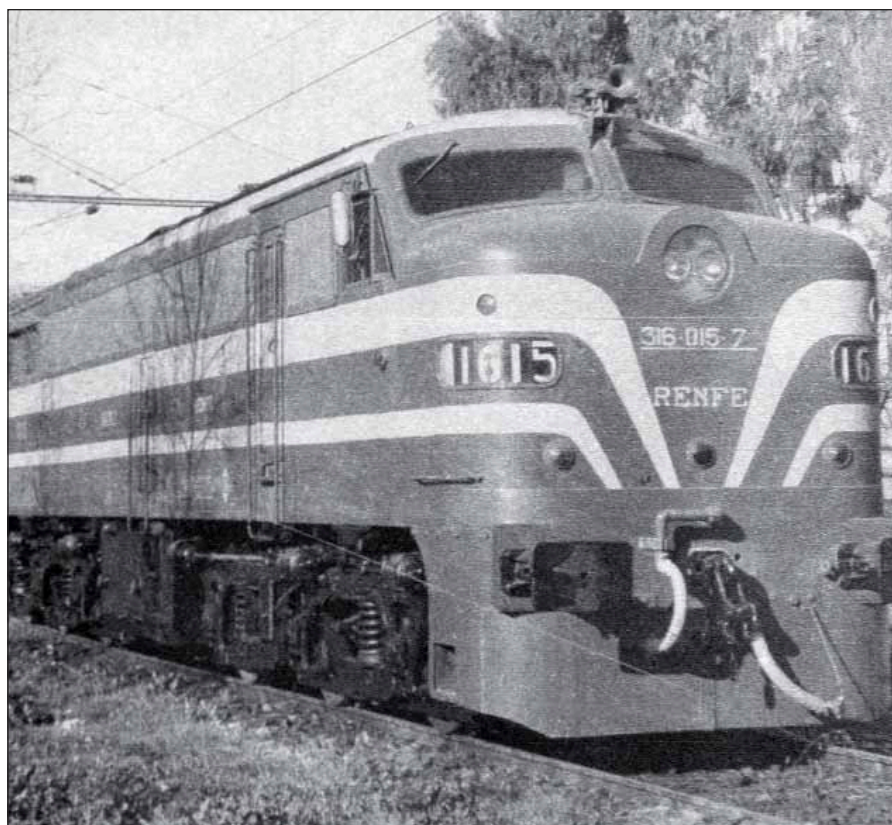
Retirada la primera locomotora diésel de línea de Renfe .